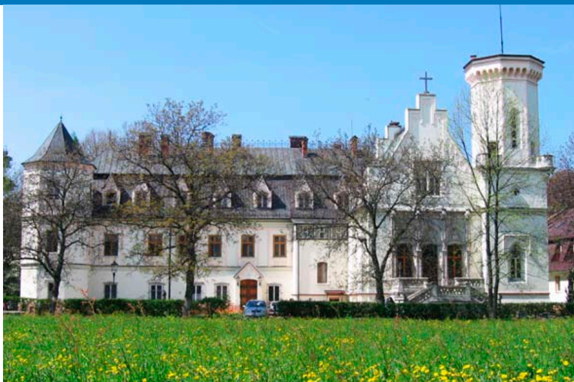
Dom Pomocy Społecznej Różany Pałac w Krzyżanowicach