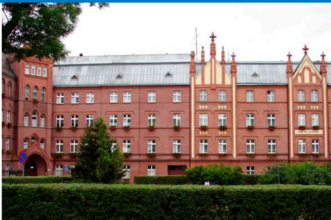
Dom Pomocy Społecznej św. Notburgi przy placu Jagielly w Raciborzu