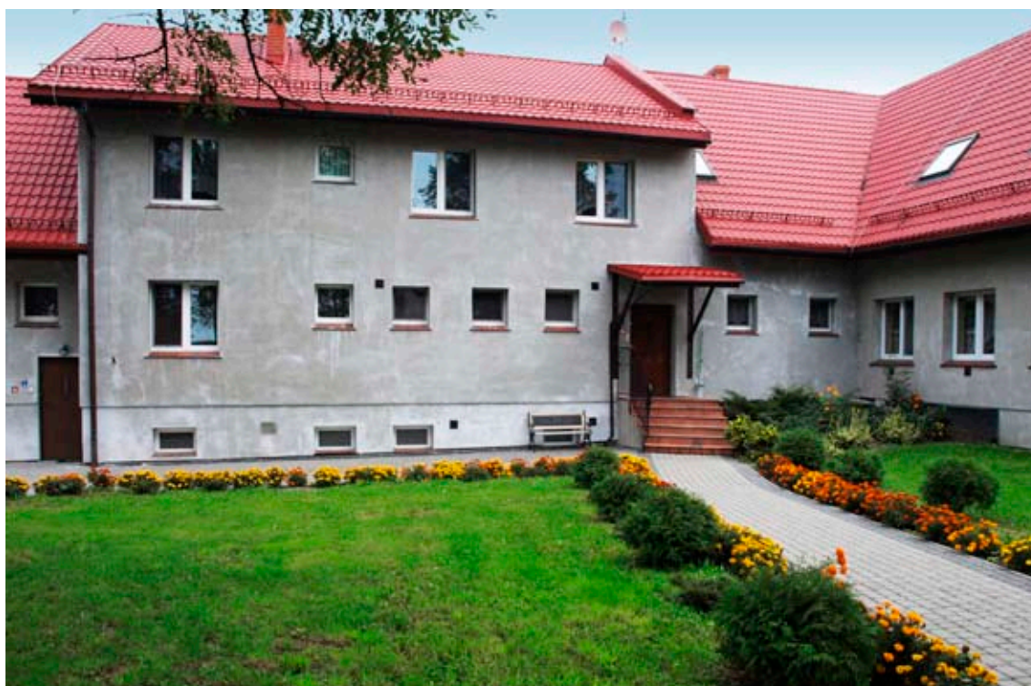
Wielofunkcyjna Placówka Opiekuńczo-Wychowawcza im. M. Laury Meozzi w Pogrzebieniu