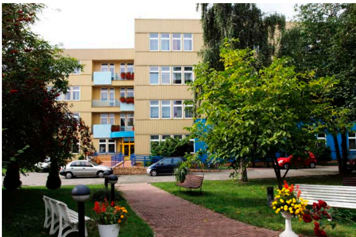
Dom Pomocy Społecznej Złota Jesień przy ulicy Grzonki w Raciborzu-Ostrogu